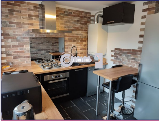
Coup de cœur